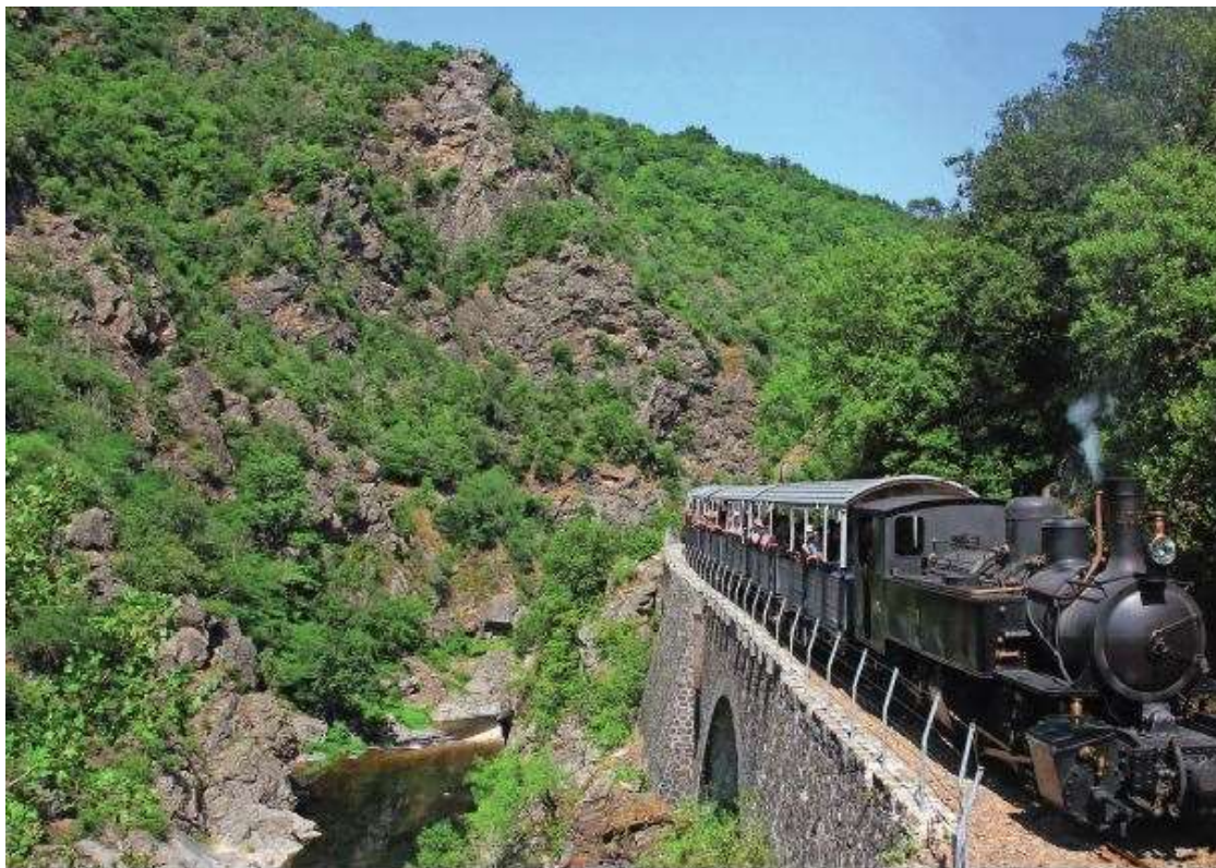
The Train de l'Ardèche in the Gorges du Doux between Tournon and Lamastre

This morning I am making myself the rich Italian stew osso buco alla milanese which will be cooking slowly for a couple of hours on top of the stove. I shall be making a saffron risotto to go with it and uncorking a bottle of Crozes-Hermitage to enjoy alongside. It's a wine made from one of my favourite grapes, the Syrah, which reigns supreme in the steeply terraced vineyards of the northern Rhône.