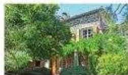
€299,000: Fifteen minutes from Tournon, a three-bedroom villa - one on ground floor - in 1,600m 2 of landscaped grounds (Courtial Immobilier)