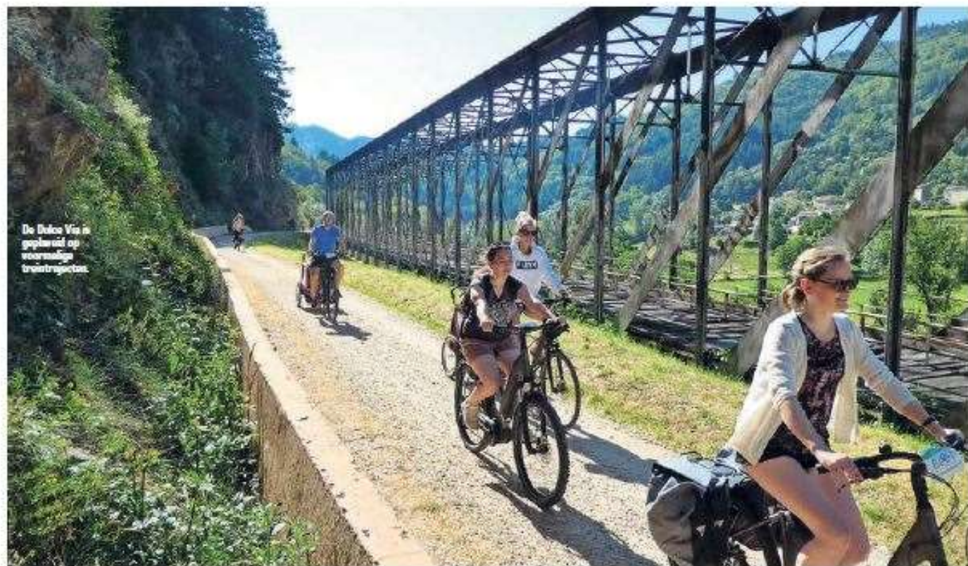
De Dolce Via is geplaveid op voormalige treinstreepjes.

schijf de en omme locon otief handmatig de goede rjchting in draaien.