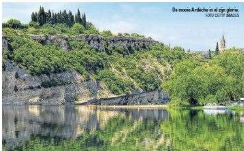
De mooie Ardèche in al zijn glorie.

Ruige en steile regio prima te verkennen