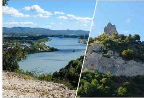
aux Vienges au coin des ruis comme autant de vigies bienveillantes aux randonneurs !