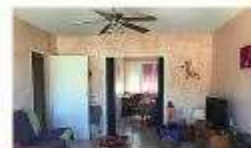
€133,000: In south Tournon, a top-floor two-bedroom apartment with balcony and open views, cellar and garage (Courtial Immobilier)