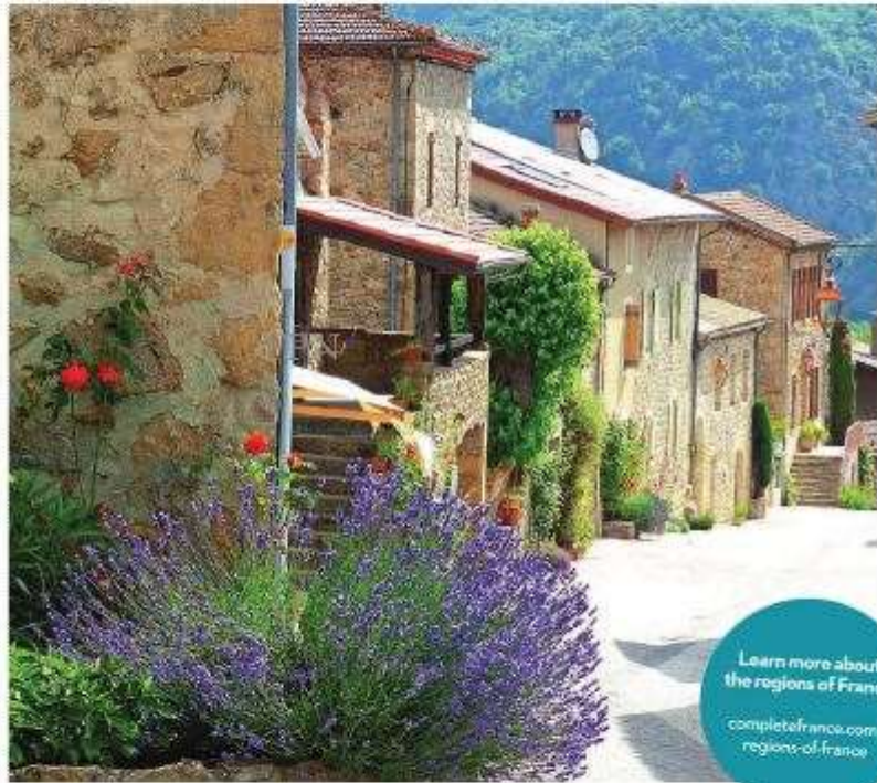
The village of Boucieu-le-Roi in the Doux valley

courtial.fr ardeche-heritage.com ville-tournon.com ardeche.com/ardeche/ ardeche-verte.php