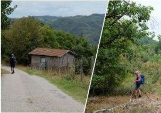
De Saint-Victor à Tournon-sur-Rhône: 7,5 km – 4 h

Un début de tronçon malheureusement beaucoup trop asphalbé, peu de chemins ni de véritables sentiers, sans compter un paysage envahissant par des lignes à haute tension. Heureusement, le fin correspond mieux à ce