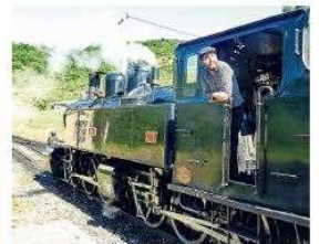
De mooie stoomtrein Maistre neemt fietsen gratis mee.

Momenteel kent Frankrijk code geel en geldt binnen een mondmaskerplicht. Sinds 21 juli moeten volwassenen een coronapass tonen bij evenementen of culturele instellingen met meer dan vijftig mensen. Dit is vanaf augustus ook verplicht in cafés en restaurants. Nederlanders kunnen de CoronaCheckapp ontol het gele boekje gebruiken. Meer info via reizendatoverdewij.nl/