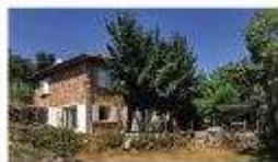
€314,000: A rural four-bed house, 30 minutes from Tournon, with pool, garden and outbuilding to renovate