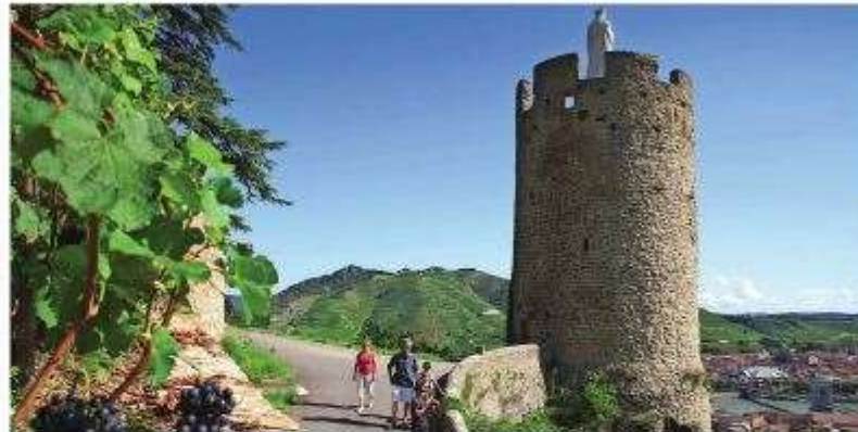
Looking out over Tournon from the Virgin's Tower

into apartments. While there are still some shops, life is somewhat quieter due to the increase in out-of-town superstores, which means you should enjoy a tranquil time in your old town pied-à-terre. It is also cheaper to buy old than to buy new. A one-bedroom apartment can usually be snapped up for €50,000-€65,000.