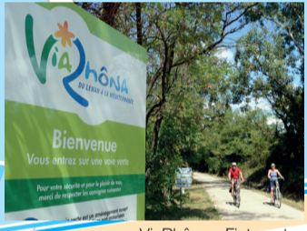
ViaRhôna - Fietsroute Voie Verte