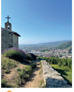
3 Kapel St-Christophe Tain-l'Hermitage